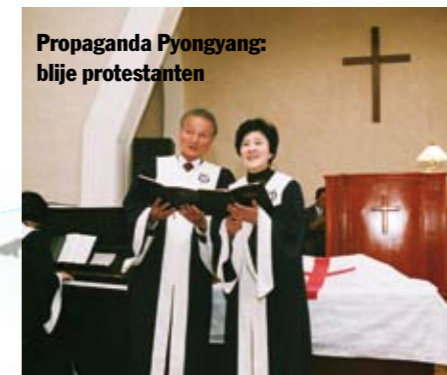
Propaganda Pyongyang: blij protestanten

Het regime in Teheran doet er alles aan om de groei van het christendom te stoppen. Afgelopen Kerst vielen veiligheidsdiensten en politie kerken aan. Ook drongen ze huizen binnen van christenen in Teheran en een aantal andere steden. In totaal zijn ongeveer zeventig aanhangers van het christendom opgepakt. Naar verluidt was de arrestatiegolf een gevolg van volkswoede tegen christenen de dagen voor Kerstmis. Streng-islamitische Iraniërs waren woedend over een felicitatiebericht dat het Iraanse parlement zou hebben gestuurd naar paus Benedictus XVI voor de geboorte van Jezus.