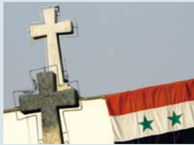
Veel christenen ontvluchten Syrië

Begin december trokken honderden islamitische Koerden plunderend en brandstichtend door het Syrische stadje Zakho waarbij ze antichristelijke leuzen scandeerden. Zeker dertig gebouwen brandden af, allemaal eigendom van christenen. Vooral in de provincie Al-Jazireh zijn Assyrische christenen – een oude christelijke stroming – vaak het doelwit . Door eerdere gewelddadigheden is het aantal christenen daar flink afgenomen en zijn Koerden nu sterk in de meerderheid. Christenen vrezen dat de Koerden autonomie of afscheiding van Syrië willen en emigreren als het mogelijk is.