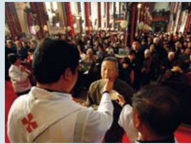
Communie tijdens Pasen in Peking

Een van de grootste kerken van China, de Shouwang-kerk in Peking, heeft afgelopen Kerst zijn laatste dienst gehouden. De kerk heeft hiertoe besloten na een reeks van incidenten. Zo werden een paar dagen voor Kerstmis 35 christenen opgepakt op weg naar een dienst. Ondanks alle intimidatie van overheidswege is het aantal belijdende christenen in China de afgelopen jaren sterk toegenomen . Dit komt door de groeiende invloed van het Westen, en ook doordat de regering sinds de Olympische Spelen in Peking de christenen vrijer laat. Toch blijven vooral de lokale autoriteiten de christenen intimideren.