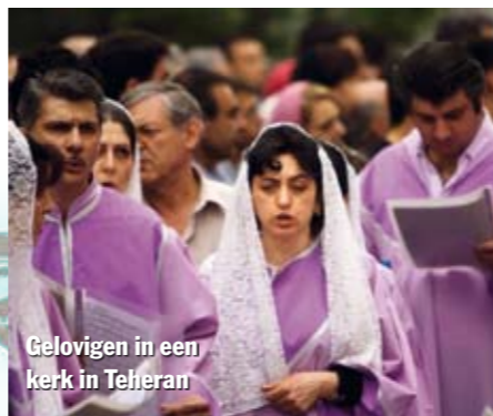
Gelovigen in een kerk in Teheran

De strijd in Irak van de laatste acht jaar bewijst dat democratie al snel kan omslaan in tirannie van de meerderheid. De christelijke minderheid – die voor 2003 bestond uit naar schatting anderhalf miljoen gelovigen –