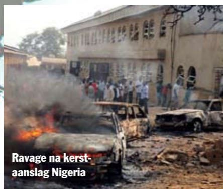
Ravage na kerst-aanslag Nigeria

Tijdens een schietpartij in een kerk in Noord-Nigeria zijn op 5 januari zeker acht doden gevallen. De aanslag is, net als de serie bomaanslagen met Kerst, waarschijnlijk het werk geweest van de islamitische sekte Boko Haram. De terreurbeweging heeft de afgelopen jaren verschillende aanslagen gepleegd op christelijke doelwitten en wil Nigeria volledig islamiseren. Vooral in het islamitische noorden is zij actief. De gespannen situatie heeft tot veel vluchtelingenstromen geleid. Zo ontvluchtten afgelopen week honderden christenen het land na nieuwe dreigementen van Boko Haram.