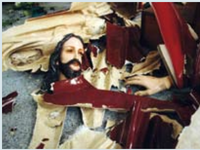
Verwoest Jezusbeeld na moslimaanslag

Een bende moslims stak op 1 en 2 augustus afgelopen jaar drie kerken in brand . Dit gebeurde in de Indonesische provincie Riau op het eiland Sumatra. Ruim honderd moslims op motoren overgoten de gebouwen met olie en staken ze in brand. Ondanks de wettelijke godsdienstvrijheid in het grootste moslimland ter wereld, neemt de invloed van de sharia , de islamitische wetgeving, op regionaal niveau toe. Geregeld worden kerken gedwongen hun deuren te sluiten of worden ze vernield . Hoewel het geweld toeneemt, is het christendom de laatste jaren toch gegroeid in Indonesië.