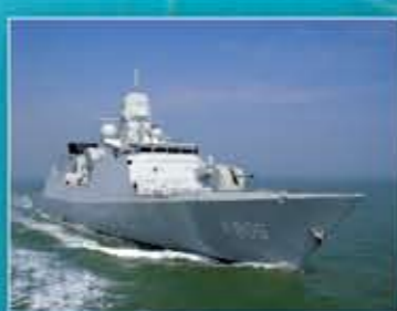
Fregat Evertsen leidt sinds 13 augustus EU-operatie Atalanta tegen de piraten