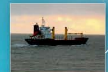
Acht Oost-Europeanen verdacht van kapen schip Arctic Sea bij Zweden